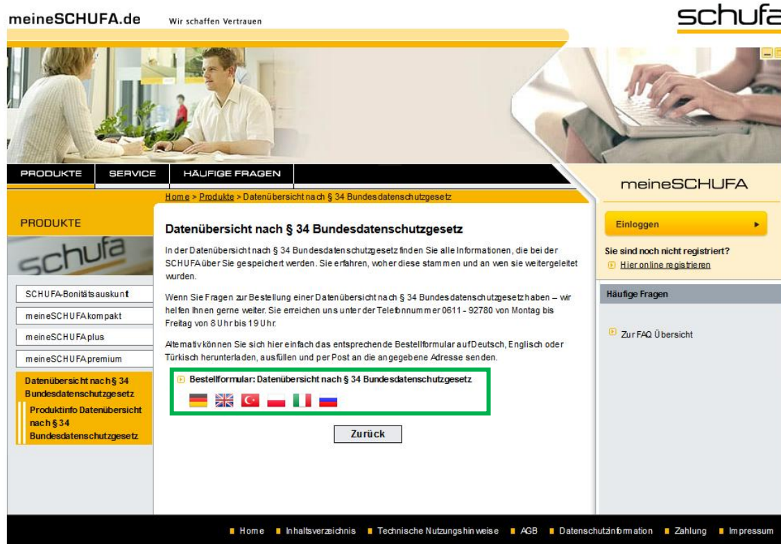
Abbildung 4: meineSchufa -> Datenübersicht nach § 34 Bundesdatenschutzgesetz?

Nach dem Klick auf „Produktinfo“ oder „Jetzt bestellen“ gelangen Sie auf eine Seite mit Informationstext nach § 34 Bundesdatenschutzgesetz. Hier sind auch Symbole unterschiedlicher Nationalitäten abgebildet. Klicken Sie auf das Symbol der gewünschten Nationalität (Beispiel Deutschland).