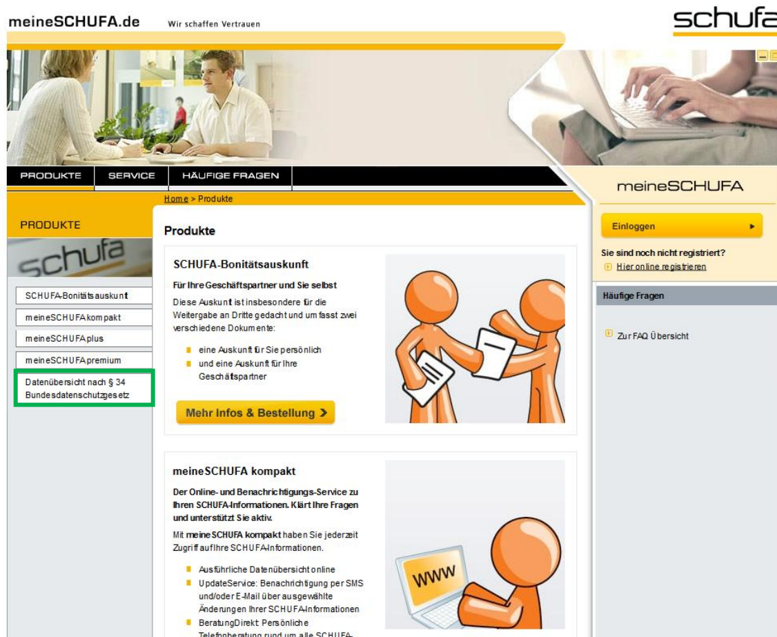
Abbildung 2: meineSchufa -> Produkte

Mit dem Klick auf Auskünfte gelangen Sie auf die Produktseite der SCHUFA. Hier werden zunächst kostenpflichtige Produkte vorgestellt. Links in der Navigation oder ganz unten auf der Seite (runter scrollen) befindet sich der Punkt Datenübersicht nach § 34 Bundesdatenschutzgesetz . Dies müssen Sie anklicken.