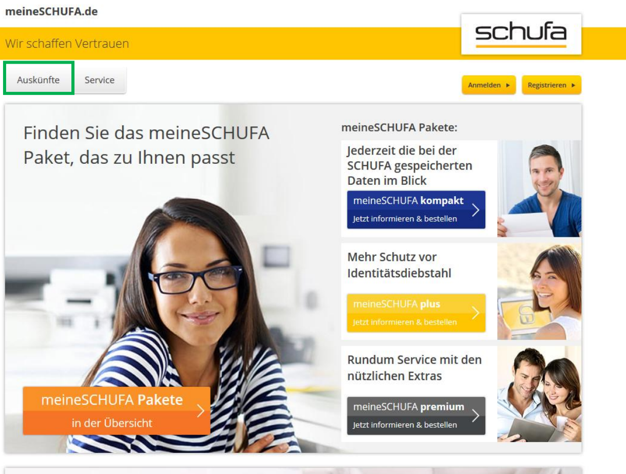
Abbildung 1: meineSchufa -> Auskünfte

Gehen Sie auf das Portal der Schufa. Dies ist unter https://meineschufa.de/ erreichbar. Auf der Startseite klicken Sie auf Auskünfte (siehe Abbildung 1).